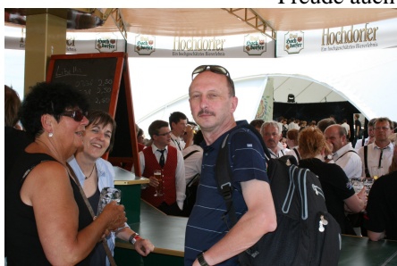
Dattinger Fans nach dem Festakt und