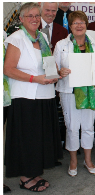
Für 160 jähriges Bestehen wurde der Gesangsverein Griefheim ausgezeichnet; Freude auch in Britzingen