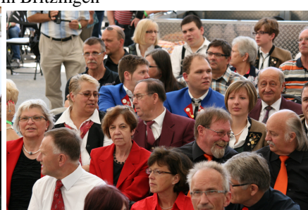
Blick in ein vollbesetztes Festzelt